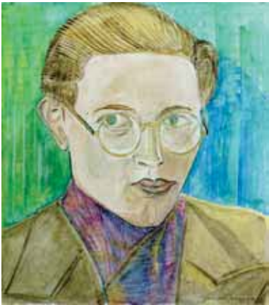
Selsportret , 1936 (Katalogus nr. 20)