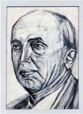
Heit , 1939 (Katalogus nr. 57)