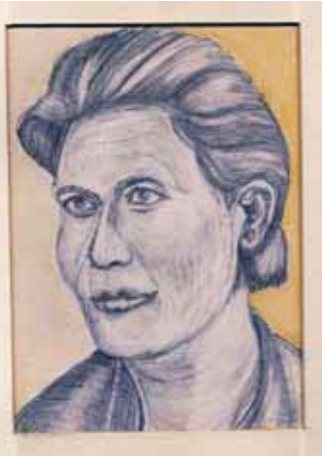
Mem , 1939 (Katalogus nr. 56)