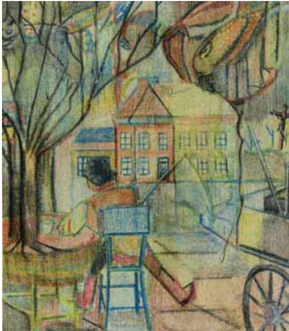
Herberch De Dolfijn (Katalogus nr. 122)