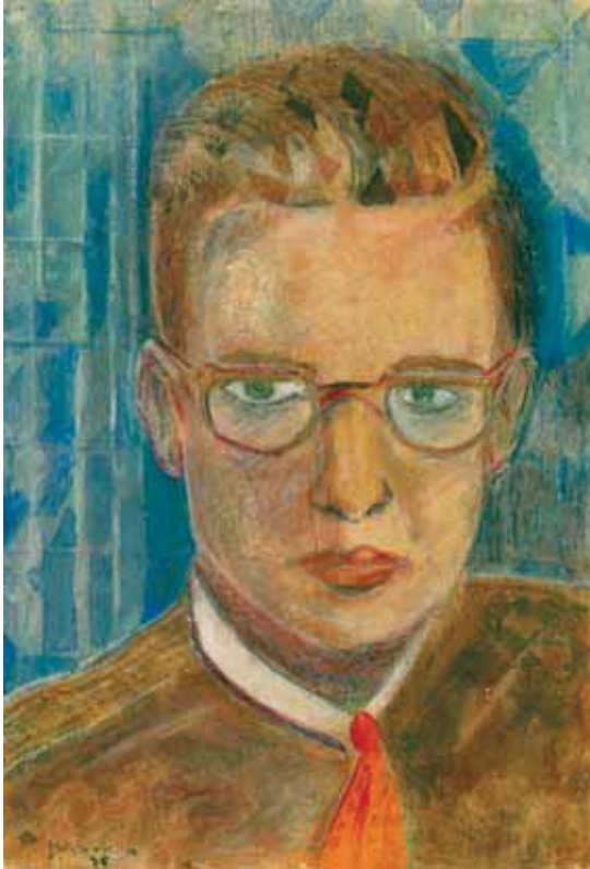
Selsportret , 1936 (Katalogus nr. 8)

Dit is de plek wantrouwen ontzenuwt hier de moed tot inkeer in dit nauwe duindal komt het wel voor dat men zichzelf ontmoet dat men zichzelf aanziet dat men moet lezen in de andere blik Dit aard suizelt van angst en vrezen (n.d., h nskrift Tresoar 2002.101.1.11)